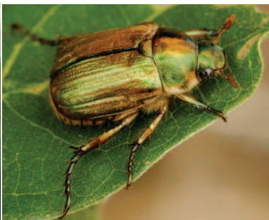
Anomala vitis. Esoscheletro senza ciuffi bianchi laterali e caudali (lunghezza: 15 mm).