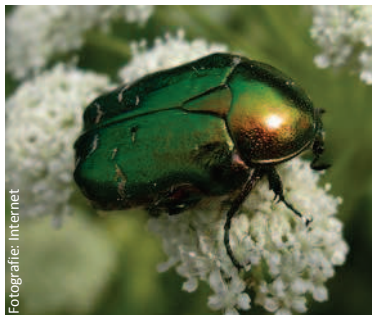
Cetonia dorata, Cetonia aurata. Esoscheletro più verde e assenza dei ciuffi bianchi laterali e caudali (lunghezza: 18 mm).