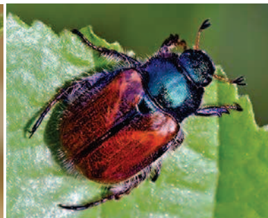
Maggiolino degli orti, Phyllopertha horticola. Esoscheletro più marrone e assenza dei ciuffi bianchi laterali e caudali (lunghezza: 10 mm).

Il coleottero indigeno che assomiglia maggiormente per forma e dimensione a Pj è il giugnino ( Mimela junii ), il cui adulto ha colore simile a Pj e presenta anche delle macchie laterali bianche. Si distingue dal coleottero giapponese in quanto è un po' più grande di Pj (lunghezza 15 mm), non presenta nessuna macchia a livello caudale e le elitre coprono tutto il corpo.